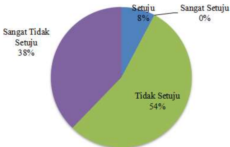
Gambar 1. Persentase hasil jawaban guru pada lembar kuisisioner pertama

Dengan intervensi dan perubahan paradigma yang dilakukan oleh penulis, diharapkan bahwa hasil kuesioner tahap kedua akan menunjukkan perbaikan dalam pandangan guru terhadap pengawas, yang pada akhirnya akan meningkatkan sinergi dalam proses pendidikan.